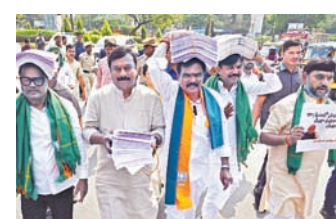
మంగళవారం బిజెపి నిరసన దృశ్యం

హైదరాబాద్, మార్చి 17, ప్రభాతవార్త: రైతు భరోసా కార్డుల ఒక్కో రైతుకు వరి ధాన్యం బోనస్ పేరిట 25000 ఆదా అవుతుందని ఉప ముఖ్యమంత్రి భట్టి విక్రమార్కు మల్లు తెలిపారు. శాసనసభలో కెటిఆర్ ప్రసంగంను అడ్డుకొని ఉప ముఖ్యమంత్రి వివరణ ఇస్తూ రైతుల శ్రమను గుర్తించి సన్నాధాన్యం పంపించిన రైతులకు క్వింటాకు 500 బొప్పెన్ బోనస్ రైతుల ఖాతాలో వేస్తున్నామని తెలిపారు. రైతు భరోసా కింద తోమ్మిది రోజుల్లో 9,000 కోట్లు కేవలం తోమ్మిది రోజుల్లో వారి ఖాతాలో జమ చేశారు అన్నారు. వడ్డీలేని రుణాల కింద స్వయం సహాయక సంఘాల మహిళలకు సంవత్సరానికి 20వేల కోట్లు పైగా వారి ఖాతాల్లో జమ చేస్తున్నామని తెలిపారు ఇప్పటివరకు వడ్డీ లేని రుణాల కింద 57 వేల కోట్లను మహిళల ఖాతాల్లో జమ చేశామని తెలిపారు. మహిళలు ఖాసు వడ్డీలే కుటుంబం మొత్తం ఖాసు వడ్డీలే ది తద్వారా రాష్ట్రం అభివృద్ధి చెందుతుందని వివరించారు. బిఆర్ఎస్ నేతలకు మహిళల పట్ల ఏమాత్రం గౌరవం ఉందో రాష్ట్ర ప్రజలందరికీ తెలుసు అన్నారు. ప్రతి సందర్భంలో కేటీఆర్ మహిళల మనసు గాయపరుస్తున్నారని ఎద్దేవా చేశారు. కేటీఆర్ మహిళల గురించి జాగ్రత్తగా ఆలోచించి మాట్లాడాలి అన్నారు. కేటీఆర్ దారి తప్పి మాట్లాడుతున్నారని అనిపిస్తుంది. మహిళల అభివృద్ధి గురించి వారికి శ్రద్ధ ఉంటే వారి క్యాబినెట్లో మహిళలకు అవకాశం కల్పించేవారు >>2